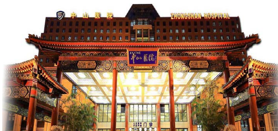
复旦大学附属中山医院

创建于 1937 年，是中国人创建和管理的最早的大型综合性医院之一，为纪念中国民主革命的先驱孙中山先生而命名，集医、教、研于一体，是上海市第一批三级甲等医院、国家卫生健康委委属医院。